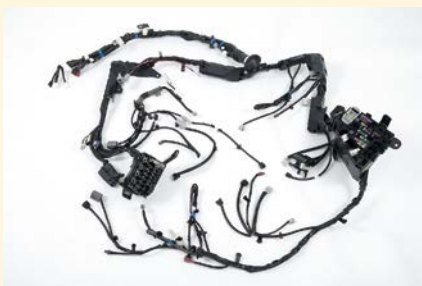
自動車用ワイヤハーネス