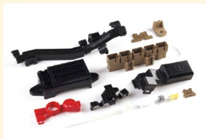
プラスチック成形品