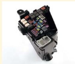
メインヒューズボックス